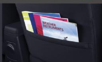
Seat Back Pocket (R All)