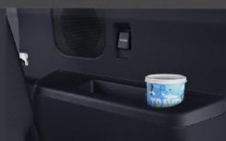
Back Seat Cup Holder