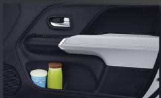
Door Trim Pocket