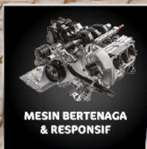
MESIN BERTENAGA & RESPONSIF