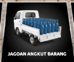
JAGOAN ANGKUT BARANG