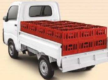
JAGOAN ANGKUT MINUMAN