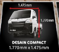
DESAIN COMPACT 1.770 mm x 1.475 mm