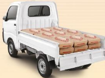
JAGOAN ANGKUT SEMEN