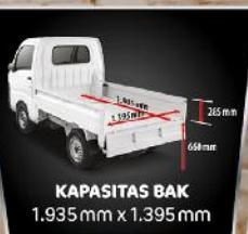
KAPASITAS BAK 1.935 mm x 1.395 mm