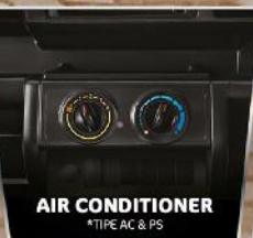
AIR CONDITIONER *TIPE AC & PS