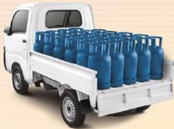
JAGOAN ANGKUT TABUNG GAS